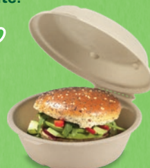
Boîte en pulpe de canne à sucre

Tous ces produits sont disponibles chez cenpac !