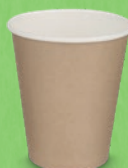
Gobelet carton brun